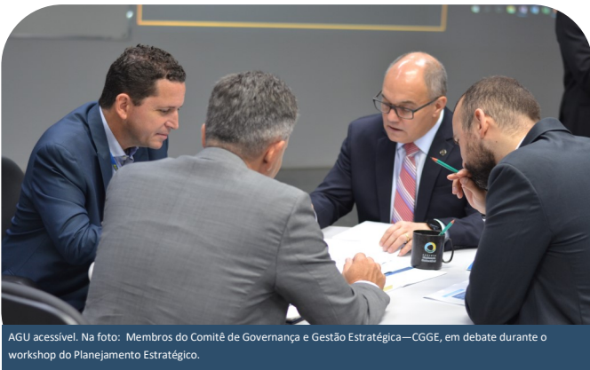
AGU acessível. Na foto: Membros do Comitê de Governança e Gestão Estratégica—CGGE, em debate durante o workshop do Planejamento Estratégico.

Dando continuidade a construção do novo ciclo do Planejamento Estratégico da Secretaria-Geral de Administração – SGA (PE SGA 2020—2023), o Comitê de Governança e Gestão – CGGE da SGA se reuniu para o “XVII Encontro de Dirigentes”, durante os dias 18, 19 e 20 de fevereiro, onde foi realizado o Workshop do Planejamento Estratégico , organizado pela Coordenação-Geral de Desenvolvimento Institucional e Riscos – CGDIR em conjunto com equipe da Universidade de Brasília – UnB. O workshop contou, também, com a participação dos membros da comissão técnica e outros servidores da SGA tanto presencial, quanto por videoconferência.